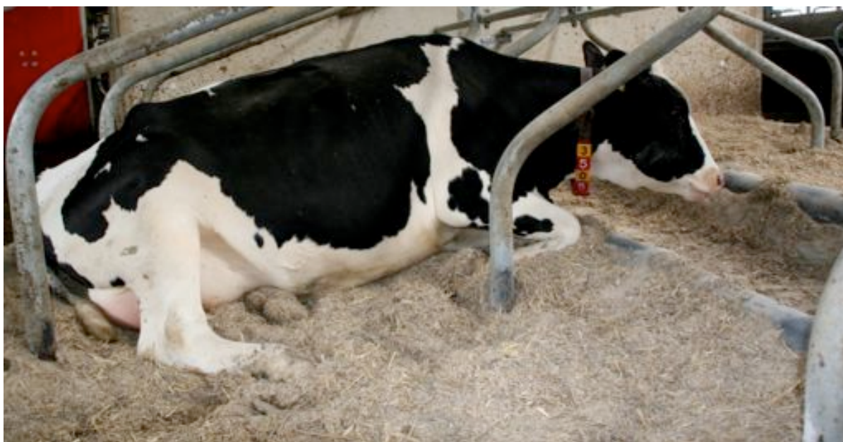
Een mengsel van stro, water en kalk vormt een zacht en droog ligbed voor de koeien, mits in de juiste verhoudingen gemengd. Belangrijk is voldoende stro te gebruiken van goede kwaliteit.