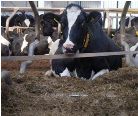
Gecomposteerde paardenmest is prima toepasbaar als strooisellaag in ligboxen

Overschakelen naar een nieuwe ligboxbedekking vergt een goede voorbereiding. Wanneer over wordt gestapt naar diepstrooiselboxen dient