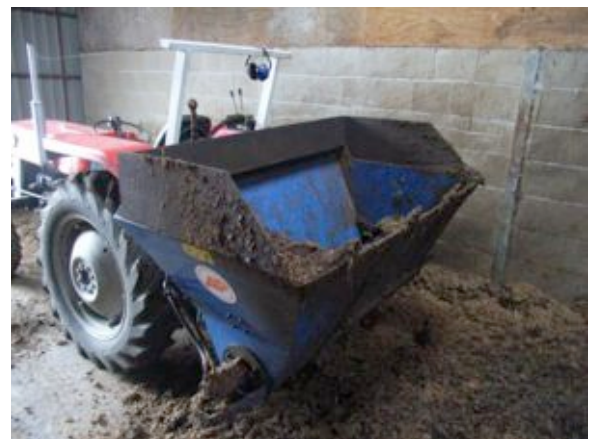
Goede mechanisatie scheelt een hoop werk en is een must in de toepassing van gecomposteerde paardenmest in ligboxen..

paardenmest is dan al dan niet een toplaag van schoon zaagsel nodig. Door goed naar de reinheid van uw koeien te kijken kunt u bepalen of het noodzakelijk is extra strooisel te gebruiken. Extra kalk kan er voor zorgen dat er een minder gunstig milieu wordt geschapen voor de groei van mastitiskiemen. Echter, overmatig gebruik van kalk kan zorgen voor schrale spenen. Dit risico is te voorkomen door gebruik te maken van een dipmiddel dat naast desinfecterende ook huidverzorgende eigenschappen bezit.